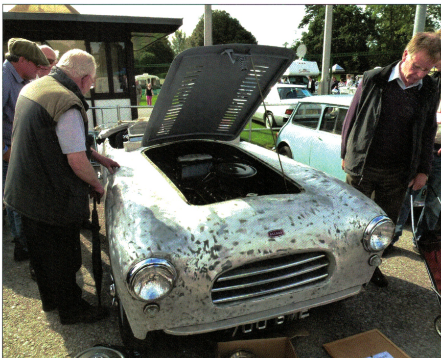
Allard laget biler fra 1937 til 1959, her en av de siste.