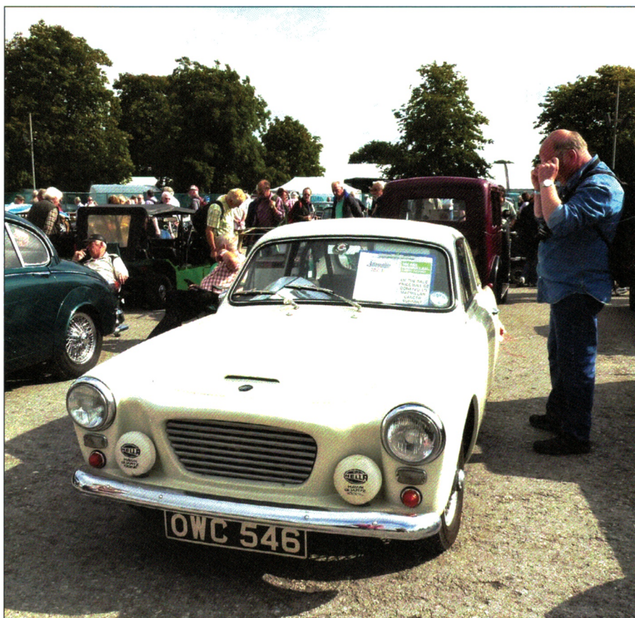
Over: Gilbern, en engelsk sportsbil med MG ramme og drivverk.

For inntrykk ble det mange av, handel ble det mindre av. Men Finn fant raskt et KNA