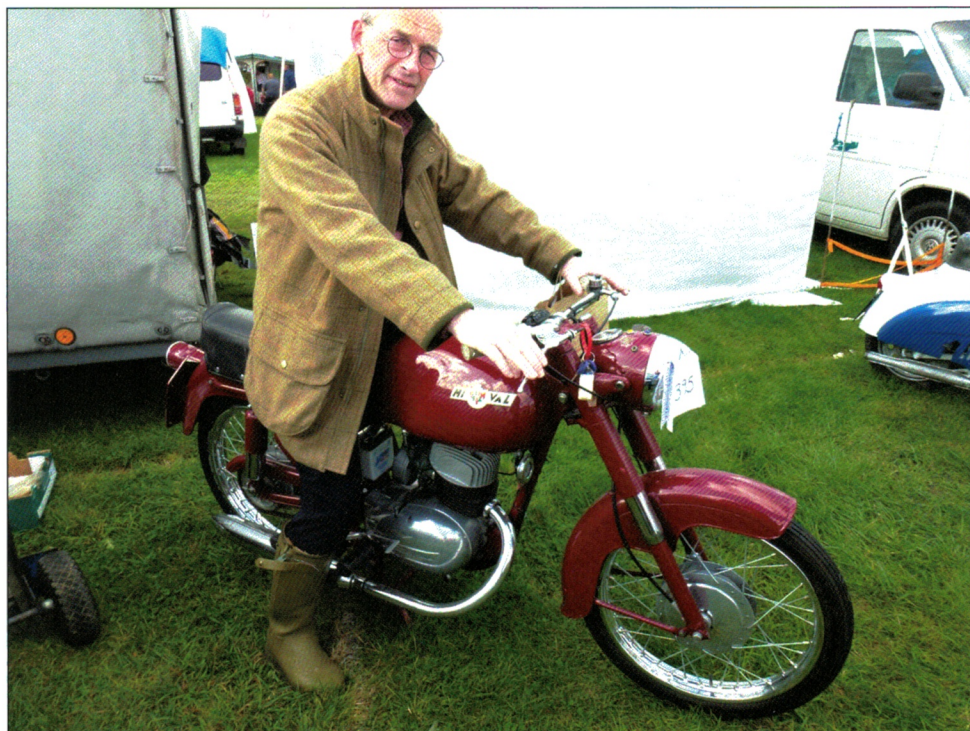
Finn fikk lyst på italiensk motorsykkel.

Det nytter ikke på et par timer å studere over 400 motorsykler i dybden. Jeg konsentrerte meg om de som hadde 4 sylindere, og de som hadde motorkonstruksjoner jeg ikke engang hadde hørt om. Har noen av oss sett en 4 syl. motor på 50 ccm, eller en motorsykkel med 5 sylindret stjernemotor? En annen hadde en 3 sylindret stjernemotor i horisontalplanet, det sto på plakaten at den hadde problemer med smøringen, og det er forståelig. At bare en håndfull maskiner ble laget skjøner vi også,