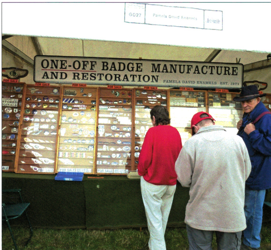
Merker i bøtter og spann.

merke, forhandlingene om et hjemkjøp ble raskt gjennomført. Vi lurte svært på hvordan et slikt merke hadde havnet så langt hjemmefra.